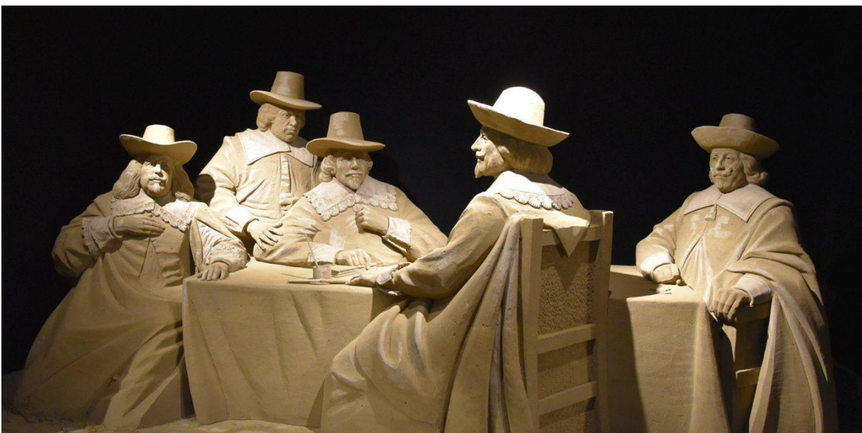
Ondersteuningsplanraad anno 1719

Hiermee zijn de beschikbare 60 uur voor personeelsleden al volledig ingezet. Voor de Oudergeleding geldt een vacatie per bijgewoonde vergadering.