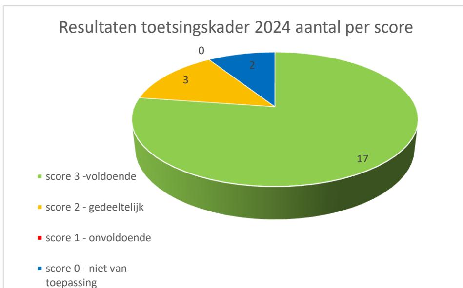
Grafiek 1: Resultaten toetsingskader 2024 SWV PO 3106